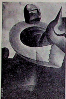
"Ecco il Duce futurista." MUSOLINI