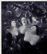
Sorpresa del volo FORLIN (Prop. Giorgio Nicelli - Milano)