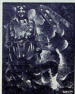
Italo Balbo FORLIN (Prop. Casa del Fascio di Ferrara)