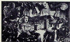
Nascita Imperiale di Carbonia FORLIN (Prop. Città di Carbonia)